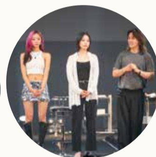
抽選会も大盛況でした♡