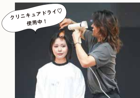
クリニキュアドライ♡使用中！