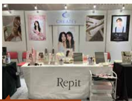
Repit Square Bar booth

エディオンアリーナ大阪で開催された御堂筋ビューティーコレクション2024では、レピおよびエプレのブースを出展。レピの新商品である「クリニキュアドライ」「グリーンケラチン」「ブラックピンパーマ」が初の一般公開となりました。