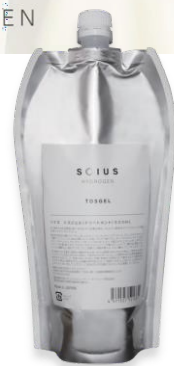
ソイストスジェル (ジェルトリートメント)