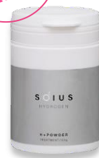
ソイスH+パウダー (パウダートリートメント)